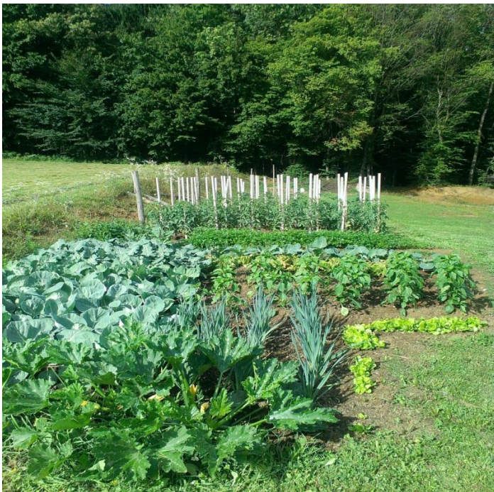
Slika 5: Lokalna pridelava živil