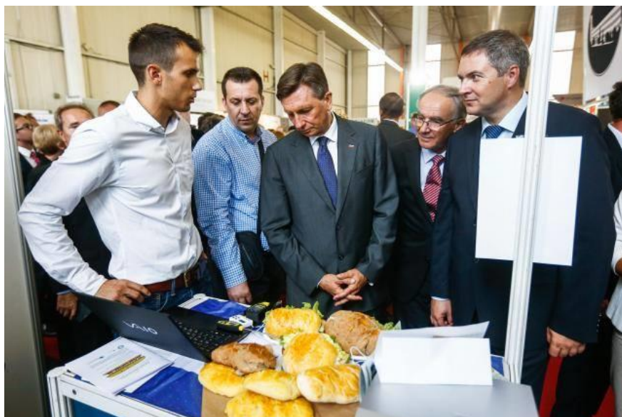
Slika 4: Na sejmu AGRA je stojnico obiskal predsednik države Borut Pahor

Aktualnost projekta za javnost potrjuje izkazan interes obiskovalcev sejma. Veseli smo bili naključnega obiska predsednika Republike Slovenije Boruta Pahorja na razstavnem prostoru Javnega sklada RS za razvoj kadrov in štipendije.